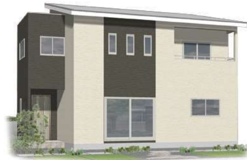
(パースはイメージです)

若い人を中心に人気の、シンプル＆スタイリッシュな家。 イワイホームのコンセプト住宅