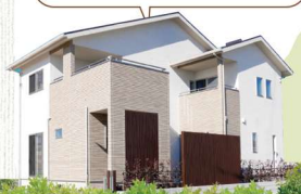
シエルヴィラにれのき WB HOUSEモデルハウス公開中