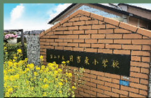
日吉東小学校 約180m 徒歩約 3分