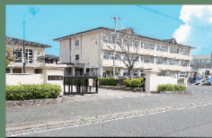
日吉中学校 約140m 徒歩約 2分