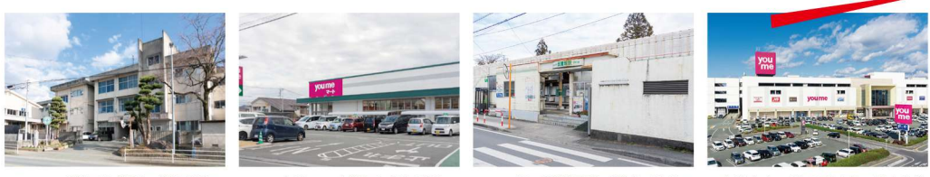
龍田小学校 / 約700m ゆめマーケット龍田 / 約420m JR 武蔵塚駅 / 約1,400m ゆめタウン光の森 / 車で約10分 (約3,620m)