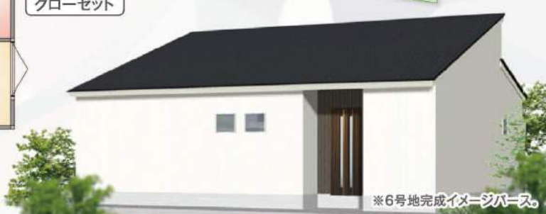
※6号地完成イメージパース