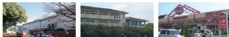
熊本市立託麻南小学校 熊本市立長嶺中学校 マックスバリュ 長嶺店