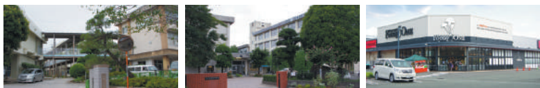
熊本市立託麻西小学校 熊本市立東部中学校 フォーティワン 御領店