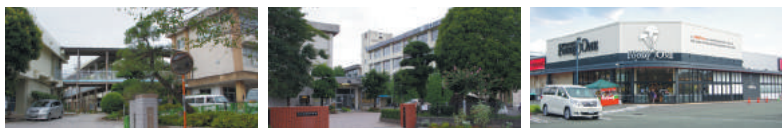
熊本市立託麻西小学校 熊本市立東部中学校 フーティワン 御領店