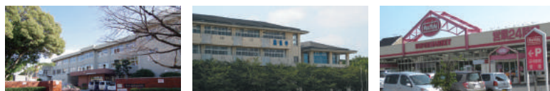
熊本市立託麻南小学校 熊本市立長嶺中学校 マックスバリュ 長嶺店