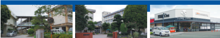
熊本市立託麻西小学校