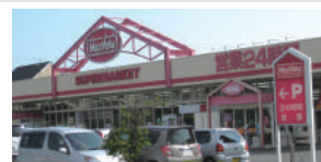
マックスバリュ 長嶺店