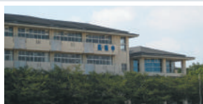
熊本市立長嶺中学校