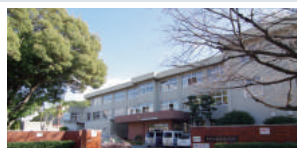
熊本市立託麻南小学校