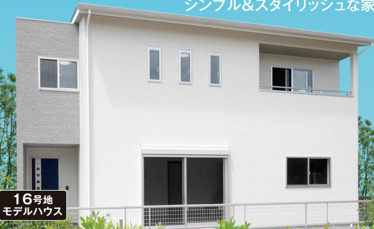
16号地 モデルハウス

【お支払い例について】●返済期間: 35年 ●金利: 熊本地方銀行金利0.9%(10年固定) ※別途保険料・融資取扱手数料・諸費用が必要です。詳しくは担当者へお尋ねください。※金利は平成30年5月現在のものです。