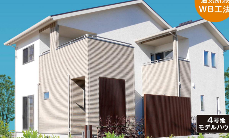
4号地 モデルハウス